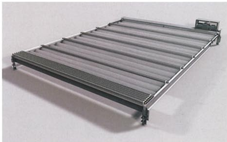
Bild 1: Die X-Velo-Dachabdeckung schützt die Produktionsumgebung wirksam vor Verschmutzungen. Sie lässt sich einfach an die Anwendung anpassen und ist lichtdurchlässig

Die HEMA Maschinen- und Apparateschutz GmbH aus Seligenstadt fertigt Schutzsysteme für den internationalen Maschinenbau und hat auf Basis ihrer SAMURAI-Faltenbälge schon Rückwandsysteme für die unterschiedlichsten Werkzeugmaschinentypen geliefert. Für ein modular aufgebautes Bearbeitungszentrum wurde ein automatisch öffnendes und schließendes Trennwandssystem konstruiert, um die Werkstückübergabe zwischen dem Arbeits- und Beladerraum zu ermöglichen.