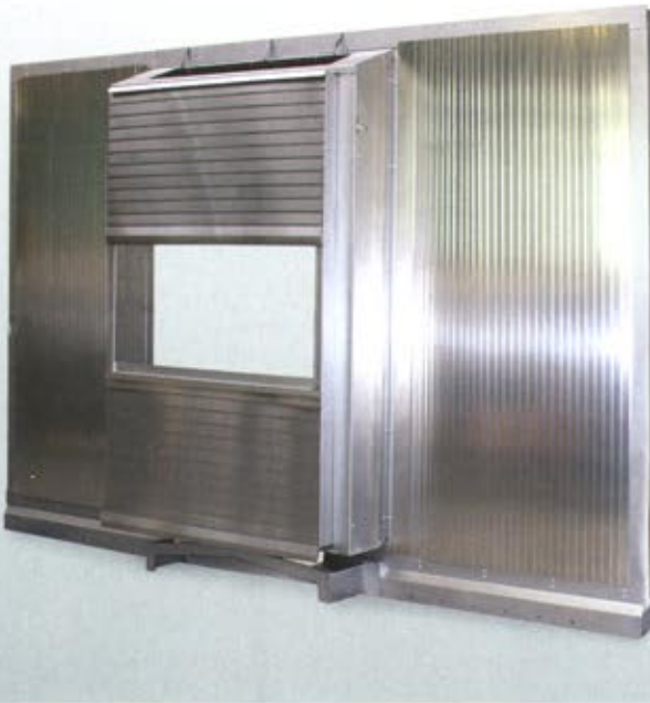
Bild 3: SAMURAI-Faltenbälge von HEMA sind eine ideale Grundlage für individuelle Rückwand-systeme in Werkzeugmaschinen

arbeitung kein Kühlschmiermittel und keine Späne aus der Maschine fliegen können. Gleichzeitig kann die Dachabdeckung zum Beladen geöffnet werden, so dass weiterhin schwere Werkstücke per Kran be- und entladen werden können. Auch Dachabdeckungen werden individuell an die Anforderungen der Anwendung angepasst und können auch nachgerüstet werden. Im Fall einer bereits im Einsatz befindlichen Portalfräsmaschine bestand die Herausforderung unter anderem