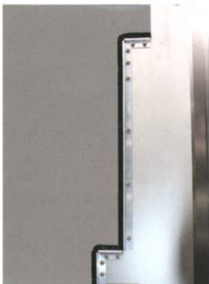
Bild 4: Die HEMA-Trennwand schließt die Querschnittsgeometrie des Maschineninnenraumes mit Hilfe von Abstreifern an den Kanten komplett ab

Für seine Faltenbälge bietet HEMA eine umfassende Materialauswahl an hochqualitativen Spezialgeweben. In der Regel wird für den Einsatz im Werkzeugmaschinenumfeld ein Material verwendet, das eine hohe Beständigkeit gegen Kühlschmierstoff und ein robustes Verhalten bei umherfliegenden Metallspänen aufweist. Die Faltenbälge werden bei HEMA auf einer CNC-Maschine genau nach Maß plissiert und zugeschnitten. Auch die Metall-Komponenten werden auf hochwertigen, rationellen CNC-Fertigungsmaschinen bearbeitet. Eine intelligente Verbindungstechnik sichert den dauerhaften Verbund der Teile. Die Rahmenkonstruktion der Dachabdeckung enthält darüber hinaus individuelle Befestigungsoptionen. Eine lückenlose Dokumentation gewährleistet, dass alle Bauteile jederzeit reproduziert und ersetzt werden können.